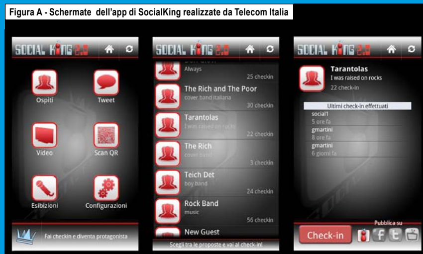
Figura A - Schermate dell'app di SocialKing realizzate da Telecom Italia

La preferenza può essere comunicata in due modi diversi. Il primo, tradizionale, consultando una lista dei contenuti in gara. La seconda modalità, più interattiva ed innovativa, avviene