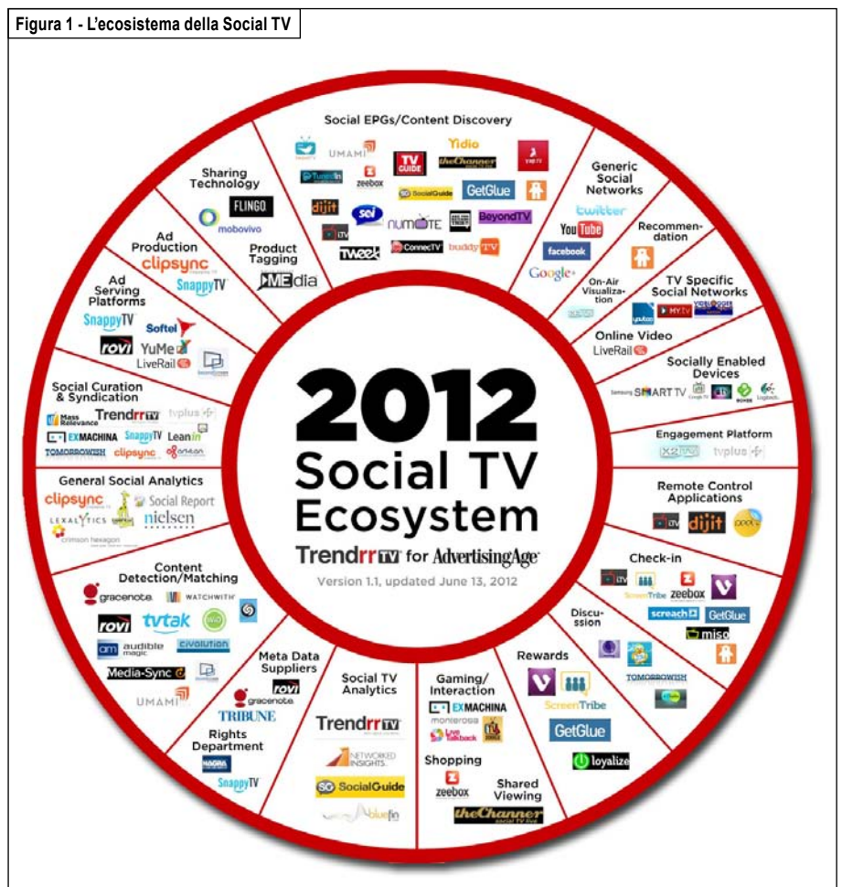
Figura 1 - L'ecosistema della Social TV

Siamo dunque di fronte a qualcosa di assai diverso rispetto alla sfida ai palinsesti televisivi, chiaramente antagonista, posta dai contenuti web-nativi. Nella Social TV l'esperienza è generata e si nutre della conversazione/interazione legata all'offerta TV. Si può persino parlare di un inatteso, quanto provvidenziale, arsenale difensivo messo a disposizione dei broadcaster, a partire da quelli generalisti, i più minacciati dall'assedio delle Internet TV.