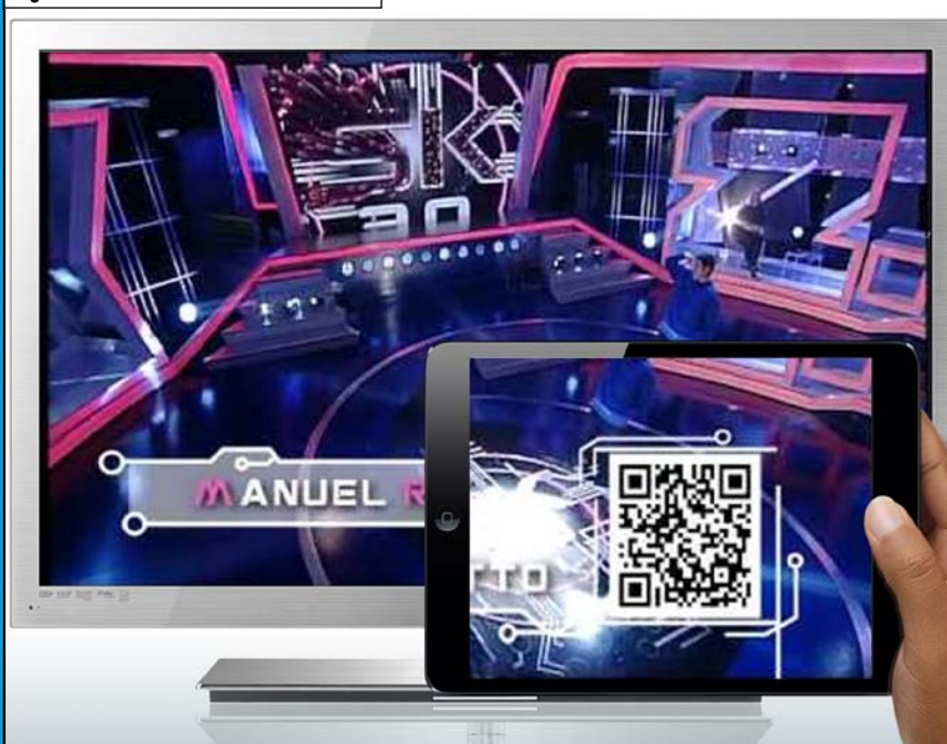
Figura B - Check-in televisivo tramite QR

Sfruttando la tendenza del momento, l'applicazione trasforma l'utente da normale spettatore a protagonista, fornendogli uno strumento per indicare le proprie preferenze e quindi condividere il proprio giudizio sul programma con la propria rete sociale di amici (Facebook, Twitter). Si sperimenta quindi l'integrazione tra realtà televisiva, mondo mobile, social network ed è un significativo esempio di convergenza tra media ■