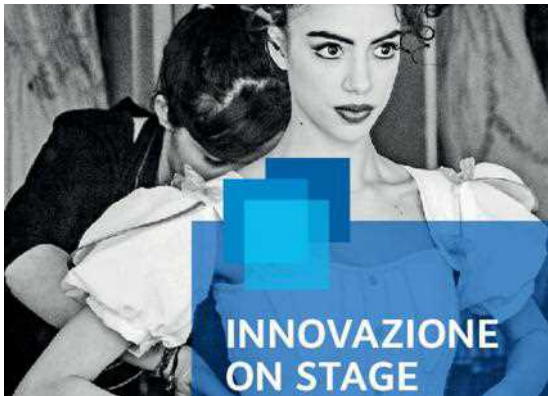
Fondazione TIM e Accademia Teatro alla Scala danno il via al tour Innovazione on stage.

Fondazione TIM e Accademia Teatro alla Scala: parte da Milano Innovazione on stage, che permetterà al pubblico di conoscere l'ampia offerta formativa dell'Accad